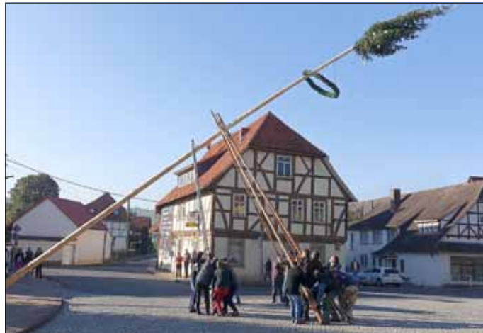
Am Sonntag, den 14.10.2018 wird nach dem Gottesdienst der Kirmesbaum aufgestellt.

Auf euer Kommen und eine schöne Kirmeszeit freuen sich die Ecklingeröder Kirmesburschen