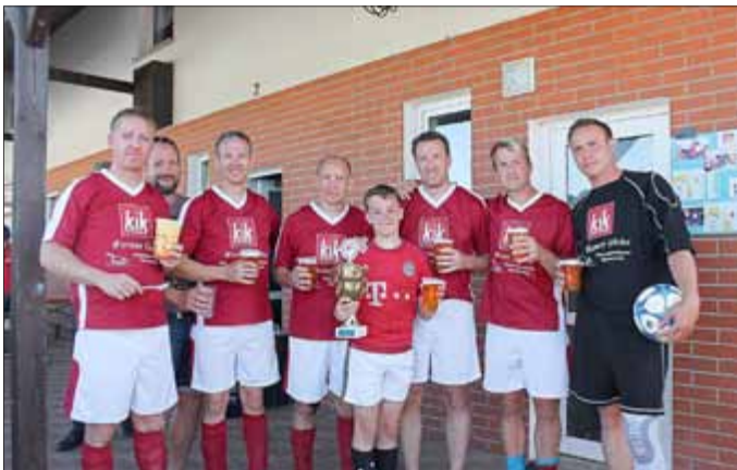
Freizeitteam von Bleckenrode