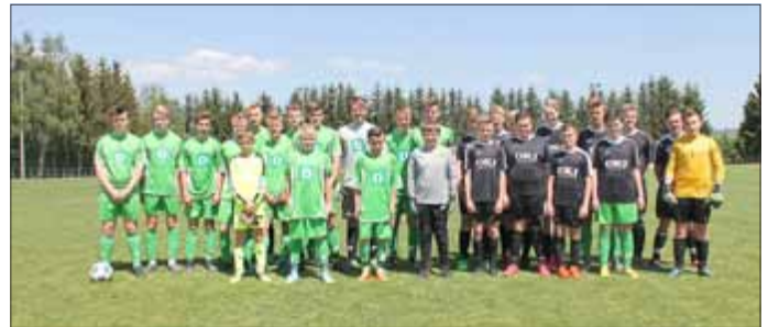
B-, C-, D-Jugend