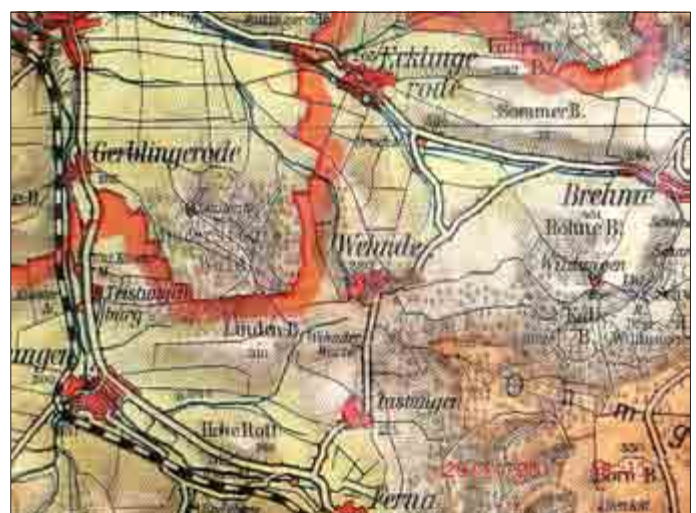
Ausschnitt aus der Karte