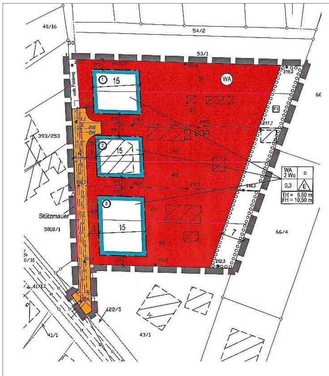
Auszug - Entwurf BP „Am Ihlberg“