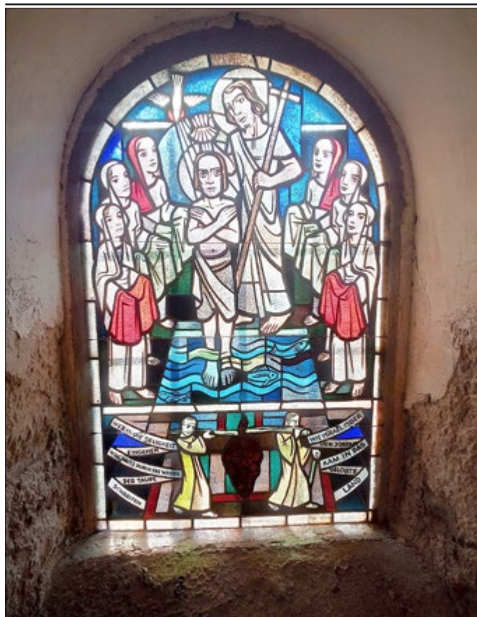
Tauffenster in Teistungen