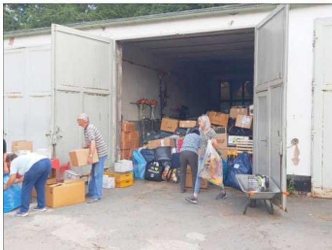
Die Firma Bockler stellte kostenlos einen Sattelzug zur Verfügung und am 21.07.2021 konnte nach Absprachen mit den Verantwortlichen aus dem Krisengebiet die Fahrt starten. Zwei Mitarbeiter des Bauhofes brachten die Spenden zu den Hochwasserofern.