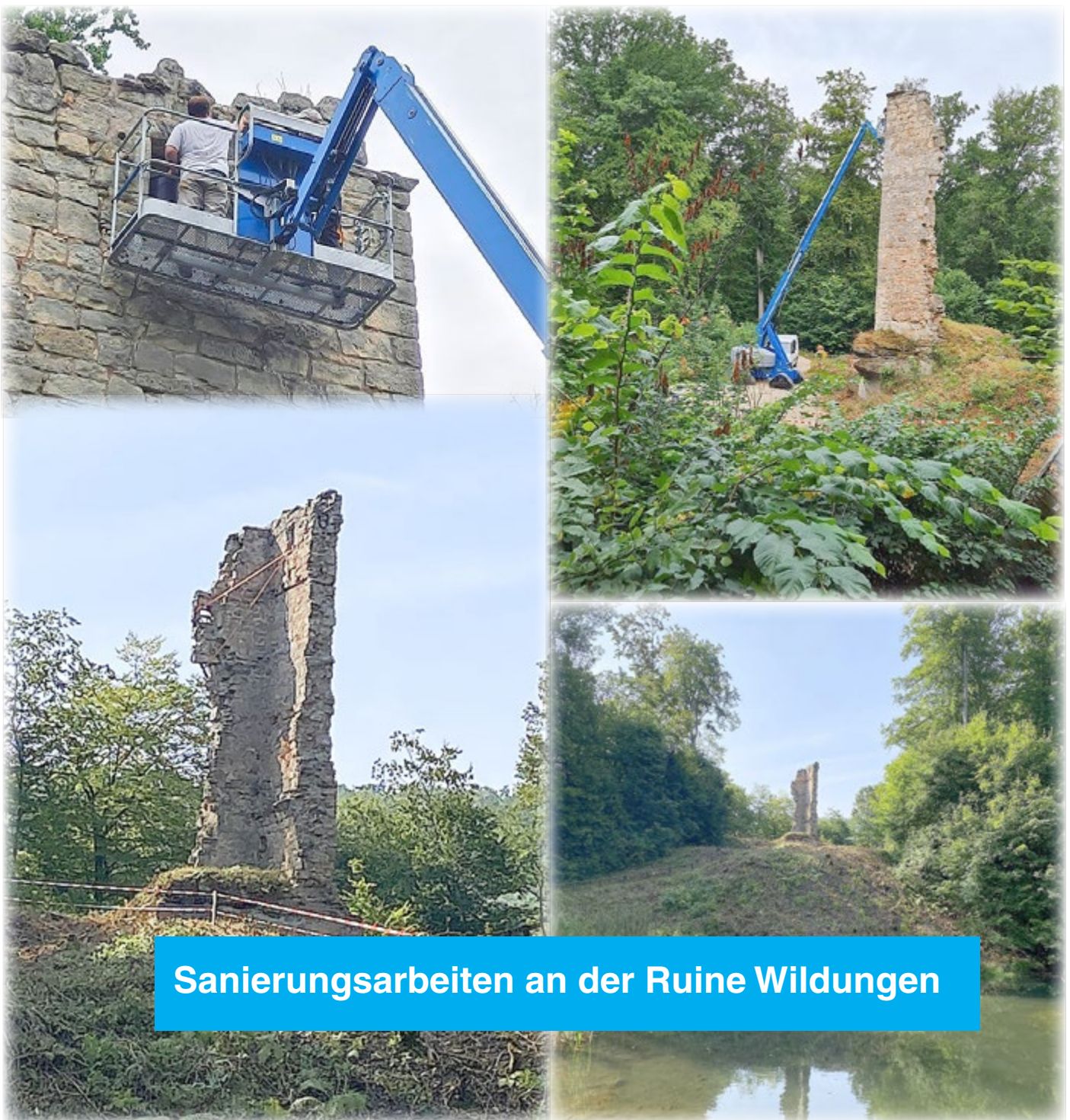
Sanierungsarbeiten an der Ruine Wildungen