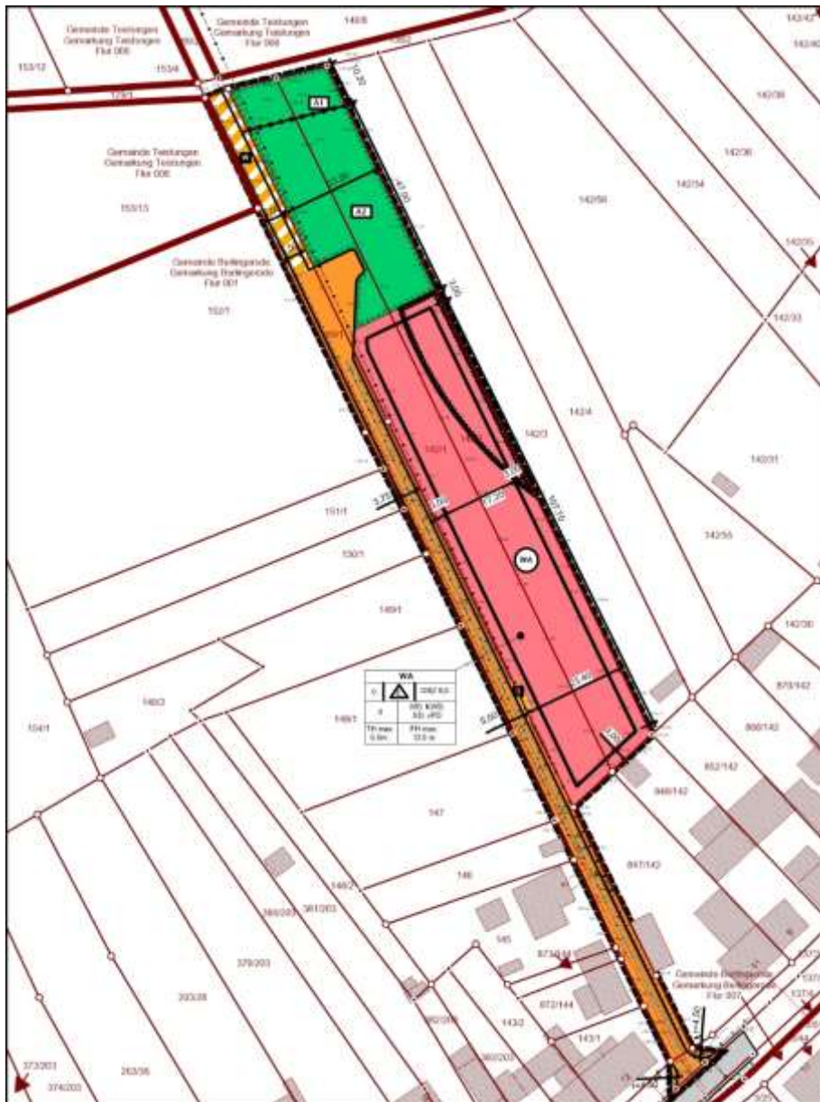
Übersicht Geltungsbereich Bebauungsplanes Nr.9,„Zum Rittersumpfgaben“

Benennung der wesentlichen, bereits vorliegenden umweltbezogene Stellungnahmen und Informationen von Behörden und sonstigen Trägern öffentlicher Belange zum Bebauungsplan: