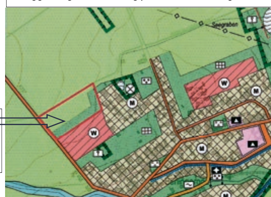
Auszug genehmigter Flächennutzungsplan der Gemeinde Berlingerode