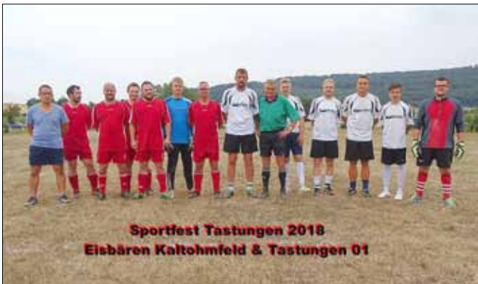
Sportfest Tastungen 2018 Eisbären Kaltohmfeld & Tastungen 01