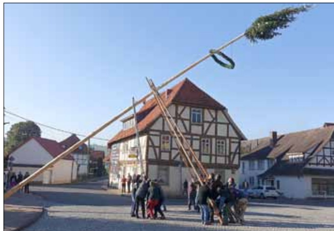
Am Sonntag, den 14.10.2018 wird nach dem Gottesdienst der Kirmesbaum aufgestellt.

Auf euer Kommen und eine schöne Kirmeszeit freuen sich die Ecklingeröder Kirmesburschen