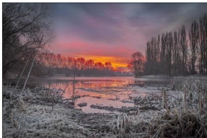
Robert Fiedler belegte im letzten Jahr den 1. Platz beim Fotowettbewerb „Lichtvariationen - Facetten des Eichsfelds“ mit seiner Einsendung „Eisiger Tageserwachen am Birkunger Stausee“.

Alle Informationen zur Teilnahme unter www.eichsfeldwerke.de/fotowettbewerb .