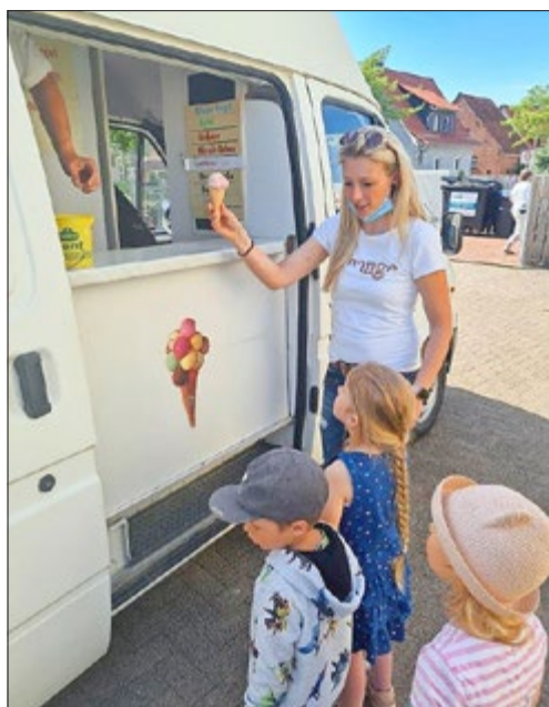
Wir wünschen allen einen guten Start ins neue Schuljahr.