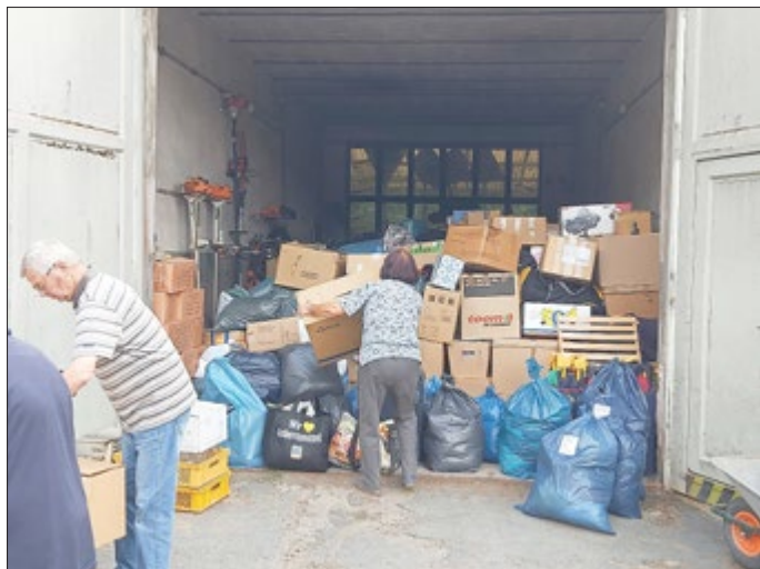
Am Nachmittag musste die Aktion beendet werden, da alle Lager- und Transportkapazitäten erschöpft waren.

Dass die spontan gestartete Hilfsaktion nicht nur von der Teistungser Bevölkerung, sondern weit über unsere Orts- und Landesgrenze hinaus Unterstützung fand, war für alle Beteiligten eine große Freude und Überraschung.