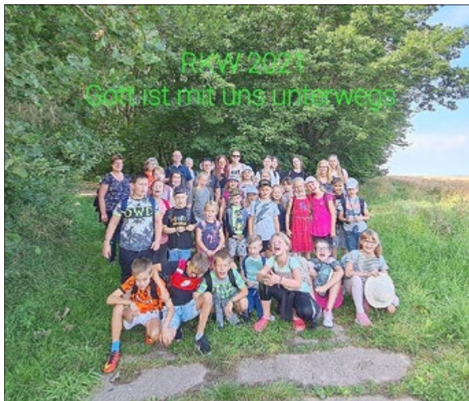
Text & Musik: Kurt Mikula

Gott ist mit uns unterwegs. Gott ist mit uns unterwegs. Mit dir, mit mir, uns allen hier. Gott ist mit uns unterwegs. Gott ist mit uns unterwegs. Mit dir, mit mir, uns allen hier. Bei Tag und bei Nacht, er gibt auf dich Acht. Bei Regen und bei Sonnenschein, Gott lässt dich nicht allein. Ob arm oder reich, für Gott sind alle gleich. Egal ob groß oder klein, er lädt uns alle ein. Was immer auch passiert, ich weiß, dass Gott mich führt. Auf seine Liebe kannst du bauen, kannst du vertrauen.