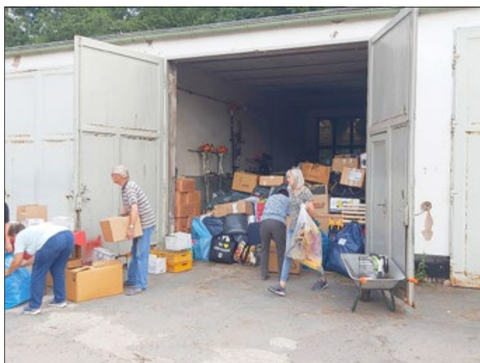
Die Firma Bockler stellte kostenlos einen Sattelzug zur Verfügung und am 21.07.2021 konnte nach Absprachen mit den Verantwortlichen aus dem Krisengebiet die Fahrt starten. Zwei Mitarbeiter des Bauhofes brachten die Spenden zu den Hochwasseroptern.