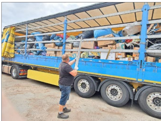
Allen fleißigen Helfern sei an dieser Stelle noch einmal ganz herzlich für die Unterstützung gedankt. Hat es uns doch einmal mehr gezeigt, dass wir eine starke Gemeinschaft sind, die zusammen anpackt, wenn Hilfe gebraucht wird. Danken möchten wir auch allen Spendern, die kurzfristig Geschirr, Kleidung, Drogerieartikel, Bettwäsche, Spielsachen usw. zur Verfügung gestellt und zum Bauhof gebracht haben.