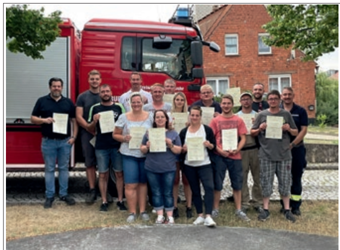
Einige Teilnehmer der Ausbildung - Prüfungsgruppe 1

Eine weitere Ausbildung ist derzeit wieder in Planung!