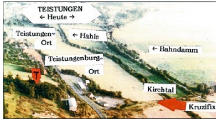
Bild 4 - Ballonaufnahme vom Kirchtal von Lothar Wandt, Brehme, ergänzt/Conraths