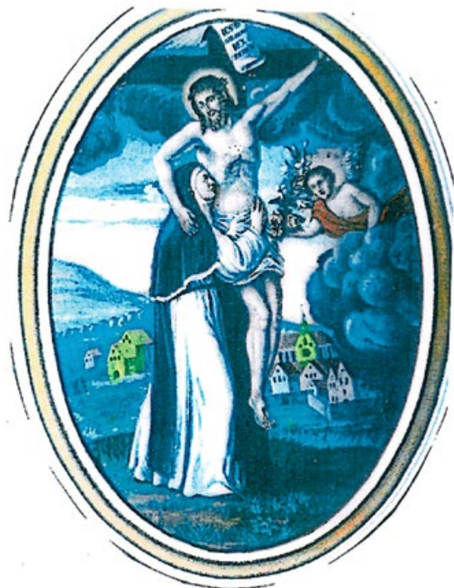
Bild 3 - Deckenbild Kapitelsaal von Leo Engel, Ecklingerode