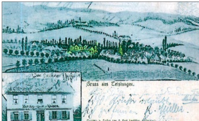
Bild 2 - Gruß aus Teistungen, von Lagillier