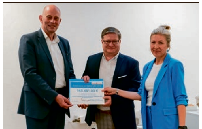
Wirtschaftsminister Wolfgang Tiefensee übergibt den Zuwendungsbescheid an Bürgermeister Thomas Spielmann und Projektleiterin Jeannette Löser

Für das Projekt werden Fördermittel in Höhe von 145.461 € bereitgestellt, die aus der Gemeinschaftsaufgabe „Verbesserung der regionalen Wirtschaftsstruktur“ (GRW) stammen. Die Fördermittel werden für den Ausbau der Wanderwegeinfrastruktur verwendet, beispielsweise für die Schaffung eines digitalen Infopoints für Wanderer. Somit wird der 122. Deutsche Wandertag im nächsten Jahr zu einem Erlebnis für alle Beteiligten.