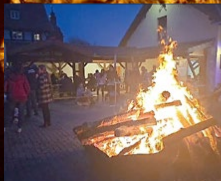
Teistungen/ OT Böseckendorf